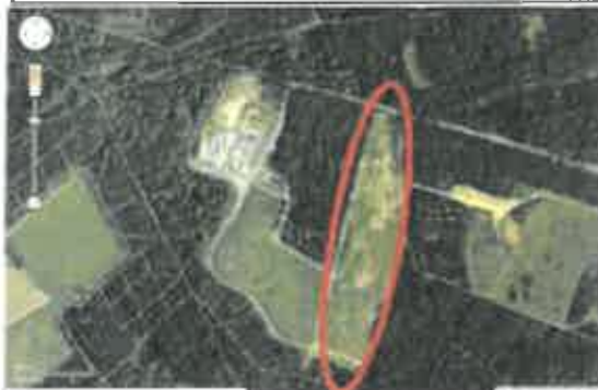
Situation des parcelles concernées par les plantations TTCR

L'expérimentation des plantations de TTCR (Taillis à Très Courte Rotation) sur 30 parcelles de l'ancien site a bien débuté en 2013 et a été poursuivie en 2014. Le robinier a été choisi pour ses racines pouvant atteindre 1 mètre alors que la géomembrane qui recouvre le casier est située à 1,2 mètres sous le niveau du sol.